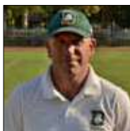
Giuseppe Alpini Running Backs

Nato a Roma nel 1972. Comincia nei Gladiatori Roma con cui arriva a disputare ben 3 Super Bowl in un decennio di carriera sportiva, come DB e WR. Continua poi nel flag football fino a raggiungere il titolo di Campione d'Italia nel 2009 con i Marines Lazio e vicecampione d'Europa con la nazionale senior di flag nel 2009. Inizia in giovane età ad allenare nelle scuole football dei Gladiatori Roma. Dopo esperienze ai Ducks Roma e ai Marines Lazio, nel 2006 arriva per una prima volta in Ancona, come DC, poi agli Angels Pesaro nel 2009 dove diventa HC nel 2010 e 2011, arrivando alla semifinale LENAF. Nel 2009 entra nel coaching staff del Blue Team per gli Europei in Austria. Torna ai Dolphins a metà 2012 come DC. È anche HC della nazionale di flag football, con cui vince la medaglia d'argento agli Europei 2013.